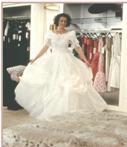
Obrázok 23. – Four weddings and a funeral 1994.

V Anglicku, viac ako v iných krajinách nevesty dbajú na tradície, ktoré zaviedli nevesty kráľovskej rodiny. Dokonca vo filme Štyri svadby a jeden pohreb z roku 1994 sa objavili šaty podobného romantického strihu. Niet sa čomu čudovať, že tento typ šiat s bohatou sukňovou časťou a riasenými balónovými rukávmi sa u nás objavovali po celé 90. roky 20. storočia.