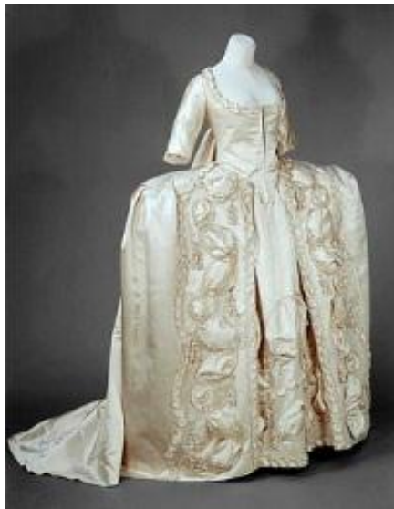
Obrázok 2. – Robe à la française, Británia, 1775-1780.