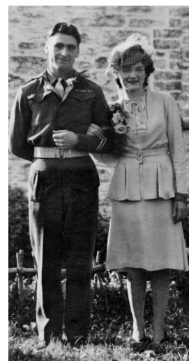
Obrázok 10. – Neznámy pár, 1945.

Temná atmosféra vojnových rokov sa skončila pádom Hitlera a nacizmu a život sa opäť postupne vracal do normálu. S ustupujúcimi obmedzeniami na konci vojny svitlo na lepšie časy aj módnemu priemyslu. Už od roku 1945 bola maskulínna silueta vytlačovaná mäkkými oblými siluetami a do popredia sa opäť dostala ženskosť. Po rokoch asketizmu sa ženy opäť začali oddávať vzrušeniu z provokácie a extravagancie. Zodpovednosť za zachovanie medzinárodného mieru na seba zobrala OSN v roku 1945 a zodpovednosť za šťastné, rozmarné ženy si na seba zobral Christian Dior v roku 1947. Nakoľko bol systém prídellových kupónov zrušený v roku 1949 a hospodárska situácia sa zlepšovala, ženám nič nebránilo v tom, aby zmenili svoj šatník a prispôsobili ho aktuálnemu new look-u.