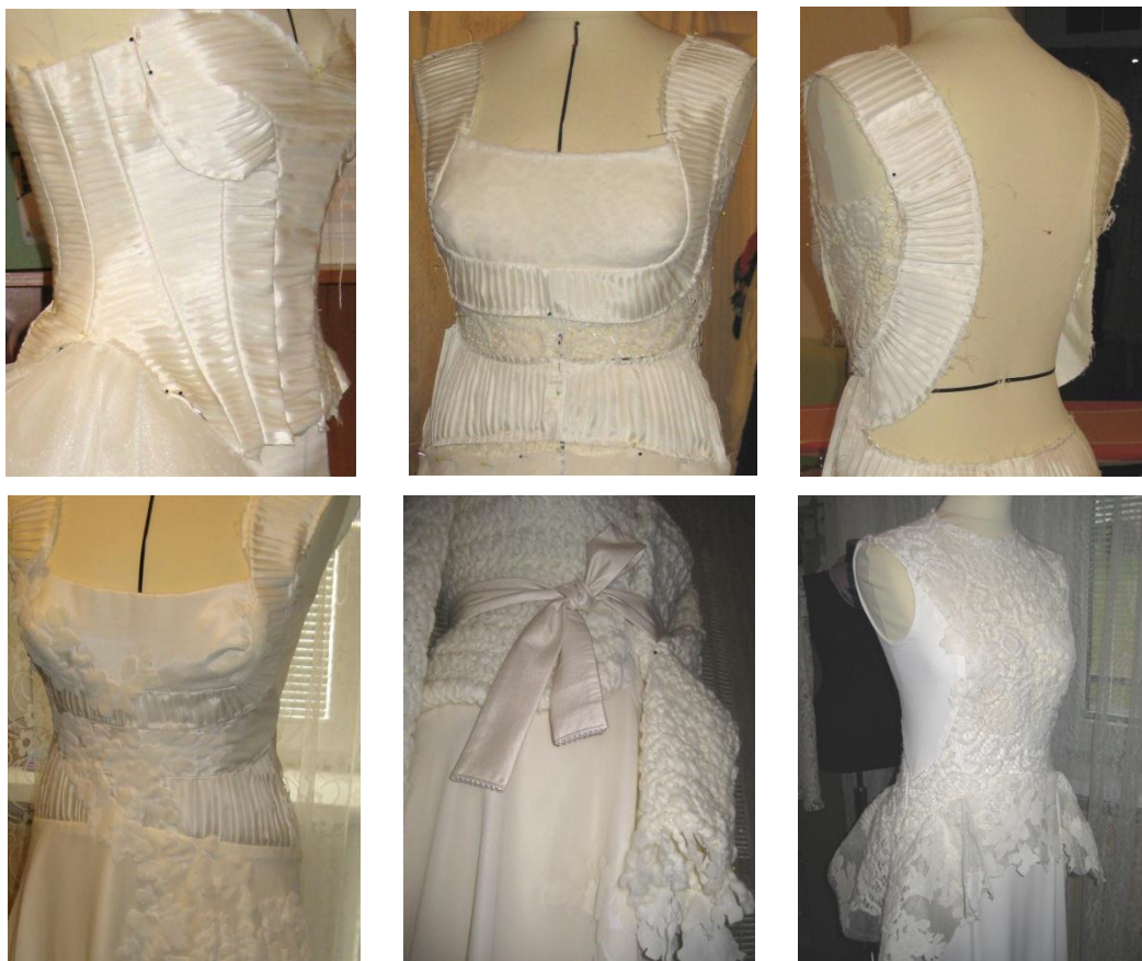
Obrázok 36. – Technická fotodokumentácia.

Strihové riešenia sa podriadili dvom vyššie spomenutým základným ideálom. V hornej časti prvých šiat je použitý strih korzetu, vystužený kosticami a je zošíty so sukňovou časťou z hodvábného tylu podloženou viacerými tylovými vrstvami a obručovou spodničkou. Sukňová časť je predĺžená do vlečky. Každý korzetový diel je spracovaný samostatne, skladaním hodvábného taftu. Hodvábný taft sa na korzetoch z 18. a 19. storočia používal veľmi často, pričom bol napríklad riasený žabkovaním a podobne. Tento model je doplnený priestorovo výraznou tylovo-taftovou ozdobou do vlasov. Prvý model je zreteľne ovplyvnený historickými prvkami.