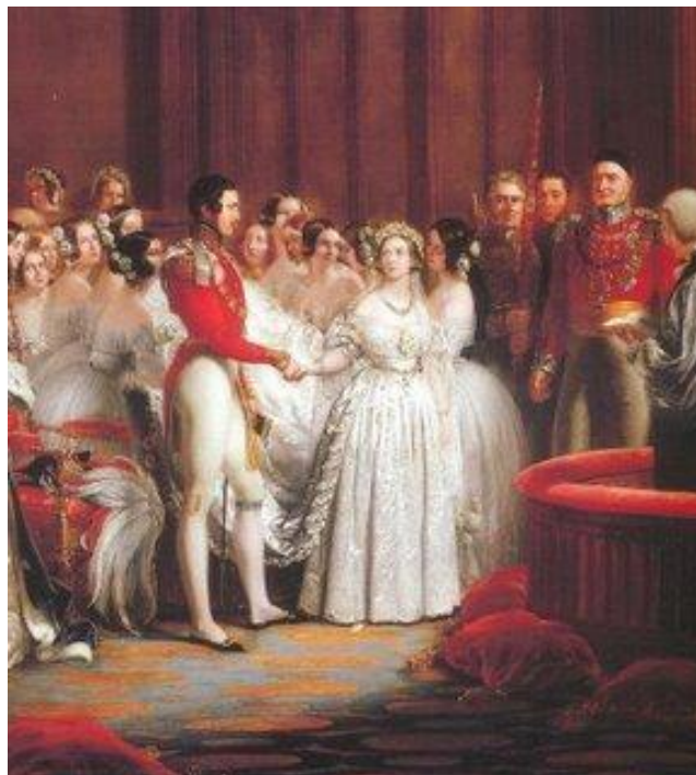
Obrázok 1. – Svadba kráľovnej Viktória a princa Alberta.