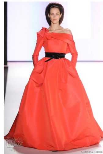
Obrázok 31. – Carolina Herrera.

Ellie Saab (39) pochádza z Libanonu, je talentovaný samouk, ktorý už v detstve tvoril pre svoje sestry a ženy v susedstve. Už ako 18 ročný si otvoril svoj butik v Bejrúte. V roku 2000 dostal ponuku predviesť svoje kolekcie v Paríži a v roku 2007 si tam otvoril vlastný salón. Jeho tvorba je zameraná na spoločenské a svadobné odevy. Od roku 2005 pracoval v svojom ateliéry v Bejrúte, ktorý je súčasťou modernej 5 poschodovej budovy. V tej sa nachádza showroom haute couture, butik pret-a-porter aj pracovňa. Každé jedny šaty haute couture sú vyrobené ručne a prejdú rukami samotného dizajnéra. Vyznačujú sa veľmi jednoduchými klasickými siluetami, ženskosťou a materiálom. Materiál je pre neho základom. Každý je špeciálne navrhnutý a vyrobený pre konkrétne šaty. Výšivky kombinuje s flitrami, kameňmi, korálikmi, textilnými 3D aplikáciami. Šaty tejto značky sú vyslovene šperkom ( www.eliesaab.com ).