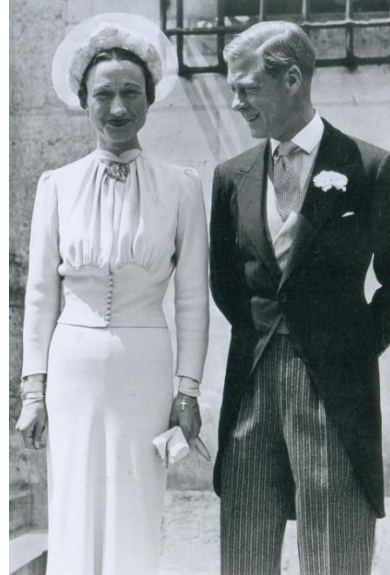
Obrázok 7. – Vojvoda z Windsoru a pani Simpsonová, 1937.