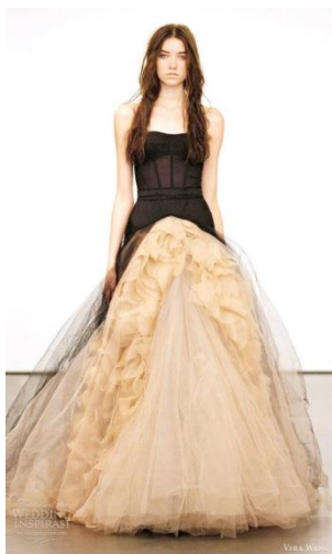
Obrázok 29. – Vera Wang.

odtíňov tej ktorej farby a vytvára sa ním svieži organický výraz. Technologickým spracovaním vytvára na šatách zaujímavé detaily. Vera Wang zavádza trendy vo farebnosti a v siluetách, jej modely sa dajú charakterizovať ženskosťou, perfekcionalizmom a vysoko kvalitným spracovaním ( www.verawang.com ).