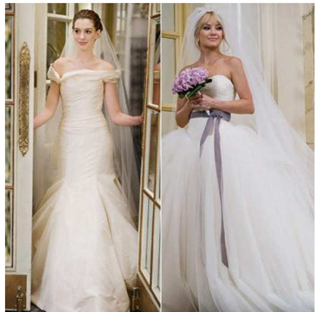
Obrázok 25. – Bride Wars.