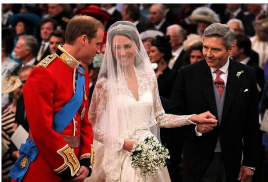
Obrázok 27. – Catherine Middleton a prince William, 2011.