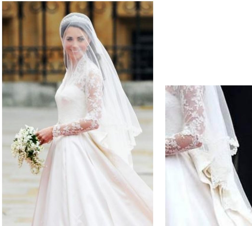
Obrázok 26. – Catherine Middleton, 2011.

Kate je známa pre svoj silný zmysel pre módu. Niekoľko krát sa v rebríčkoch najlepšie oblečených žien na svete objavila na popredných miestach. Zostala verná Sarah Burton a často krát sa na verejnosti objavuje práve v oblečení značky Alexander McQueen ( www.fashion.telegraph.co.uk ).