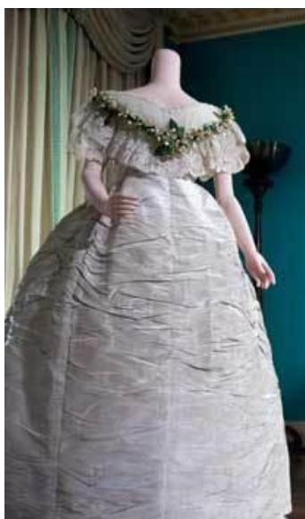
Obrázok 4. – Svadobné šaty kráľovnej Viktórie

(denník kráľovnej Viktórie, 10. február 1840)