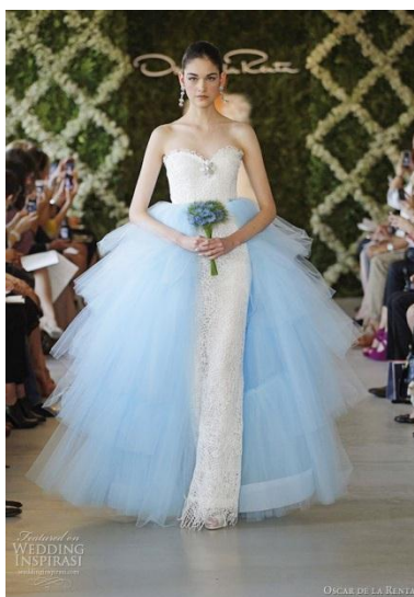
Obrázok 32. – Oscar de la Renta.

Študoval maľbu v Madride, zaujímal sa o módu a privyrábal si kreslením. Pracoval pre módný dom Baleciaga a Lanvin. V roku 1965 otvoril vlastný obchod s módou pret –a- porter. V rokoch 1973-76 ako prezident CFDA získal mnohé prestížne ocenenia a ako prvý Američan sa stal kreatívnym riaditeľom parížskeho módného domu Piere Balmain. Od roku 2006 tvorí aj svadobné kolekcie. Sám ich charakterizuje ako romantické a ženské. Vyznačujú sa použitím krásnych materiálov, alençonskej čipky, originálnymi doplnkami, ako sú závoje, topánky a kabelky.