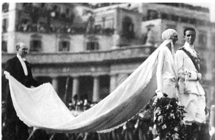
Obrázok 5. – Kráľovská taliansko-francúzska svadba, 1827.

Ideálna bola štíhla postava s dlhým krkom a malou hlavou, líčenie a gestá odpovedali nemému filmu. Vzor, či zdobenie mohlo byť v štýle art deco. Aj nevesty z najvyšších kruhov podľahli trendom a tomu prispôsobili celý svoj look.