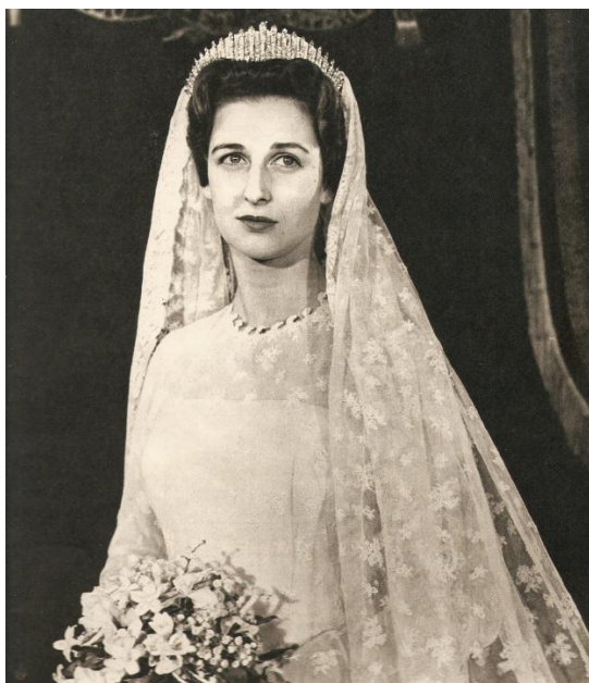
Obrázok 17. – Alexandra z Kentu, 1963.