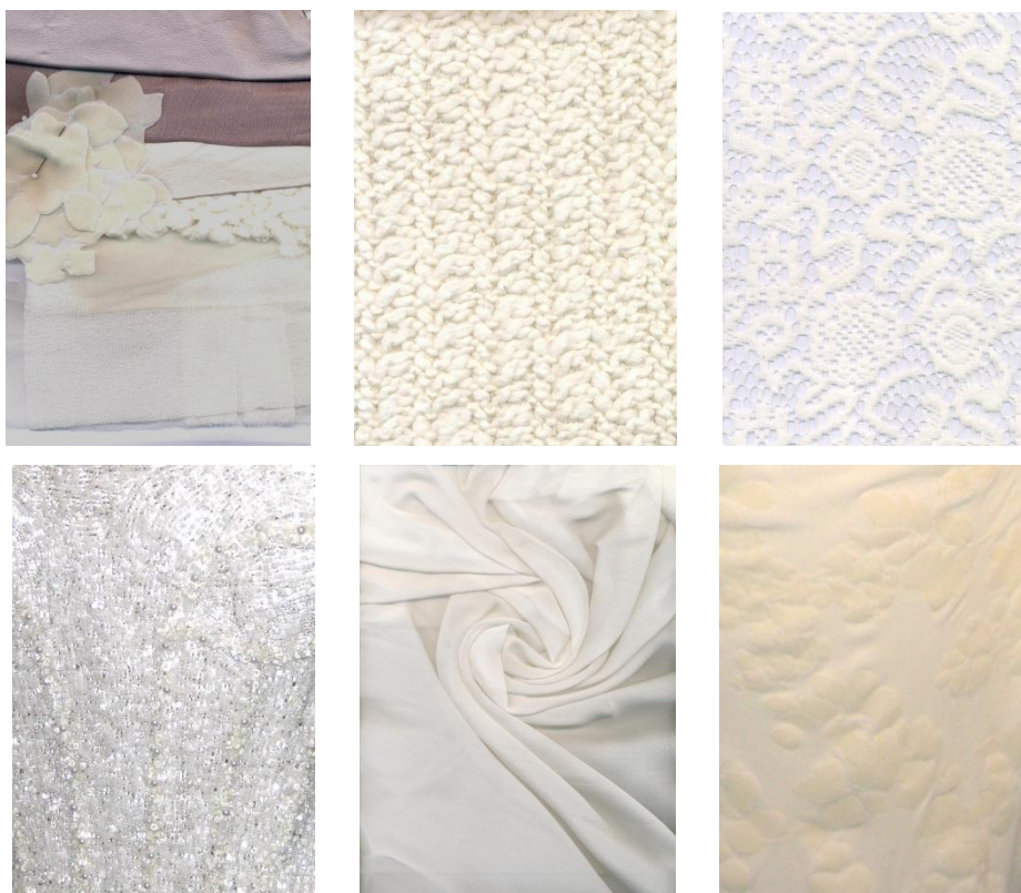
Obrázok 35. – Materiály.

Po dôkladnom naštudovaní si historickej stránky mojej témy a jej súčasných tendencií prišiel na rad výber vhodného materiálu. Spočiatku som sa sústredila na dve farby a ich odtiene, no neskôr, v snahe udržať jednotný ráz kolekcie, som sa rozhodla pracovať iba s prírodnými odtieňmi bielej farby. Prevažne som zvolila jednoduché splývavé siluety a tie som podporila ľahučkým hodvábnym šifónom a krepdešínom, ktoré pri chôdzi ožijú akoby sa samé vznášali. Pevnejšie formy som vytvorila z bavlneného základu potiahnutého ručne skladaným hodvábnym taftom. Na priliehavé modely som volila polyesterový úplet, pretože má prirodzený lesk, dobré vlastnosti čo do pružnosti to do stálosti materiálu. Tyl je použitý ako výstuž sukne v prvom modeli, no neskôr som jeho funkčný charakter zamenila za štýlotvorný v modeli, kde tvorí vrchný materiál krátkej sukne. Taktiež sa v kolekcii objavuje vlnená čipka, takisto aj výšivka na tyl, či výšivka z korálikov.