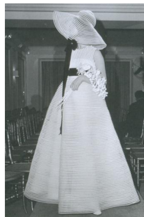
Obrázok 20. –Svadobné šaty, Lanvin, 1968