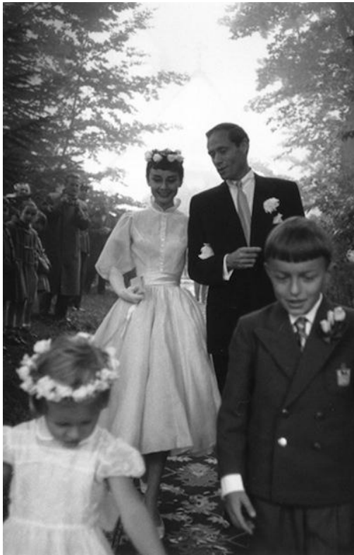
Obrázok 15. – Audrey Hepburn, Balmain, 1954.