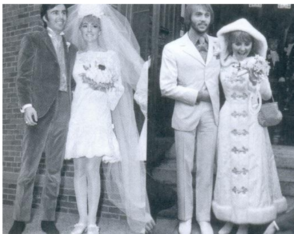
Obrázok 18. – Maurice Gibba (Bee Gees)