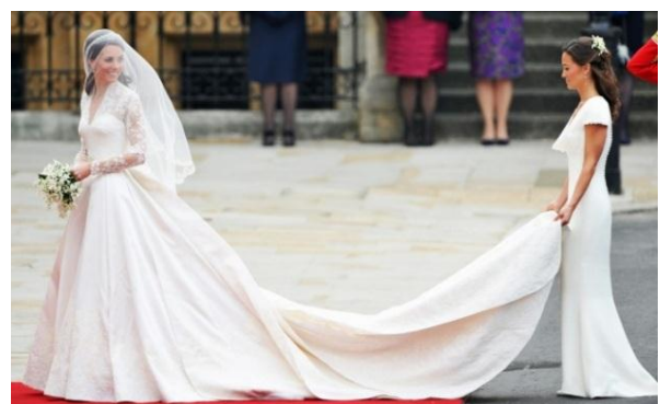
Obrázok 28. – Catherine Middleton a Philippa Middleton, 2011.