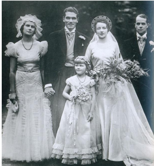
Obrázok 6. – Laurence Oliver a Jill Esmond Moore, 1930.

Vojvoda z Windsoru a pani Simpsonová sa zosobášili v roku 1937. Nevesta mala modré kreповé svadobné šaty aj doplnky. Všetko bolo vyrobené u Mainbochera, ktorý si potom, čo pracoval ako šéfredaktor francúzskeho Vogue, otvoril úspešný módný dom v Paríži. Elegantný strih jej saka, ktoré bolo v prednej časti vytvorené zo záhybov predznamenávalo koniec empírovej línie svadobných a šiat a svadobné šaty sa začali skutočne podobat' dennému oblečeniu z konca 30-tych rokov 20. storočia. Jej čelenka však ešte pripomínala módu z 20-tych rokov 20. storočia (Worsley, 2007. s. 311).