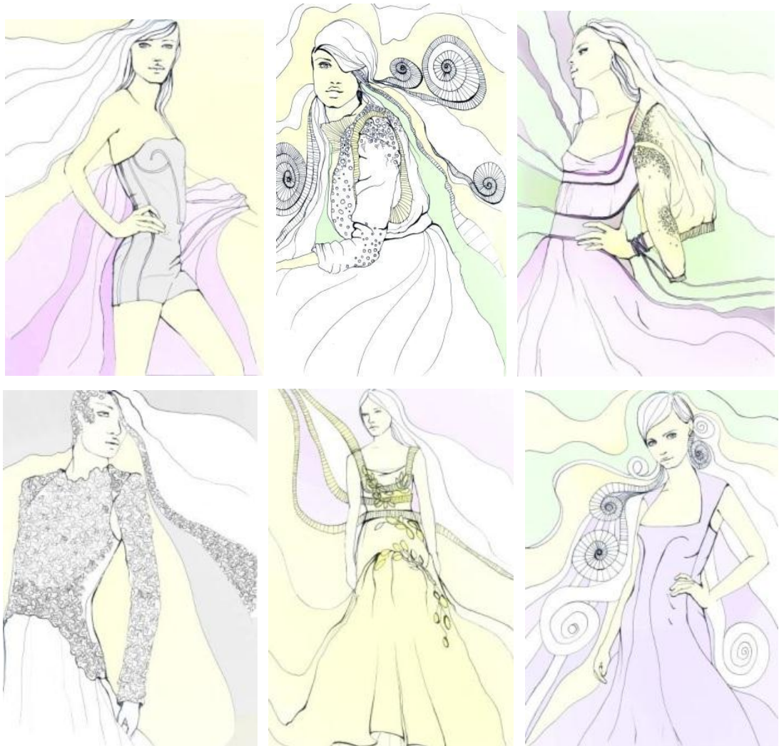
Obrázok 37. – Odevné návrhy.

Odevné návrhy, ktoré som nakreslila mi pomáhali zachovať naplánované strihové riešenie a hlavne atmosféru, ktorú by mala kolekcia navodiť.