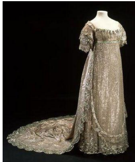
Obrázok 3. – Charlottine svadobné šaty, 1816.

Viktória teda nebola prvá, ktorá si obliekla na svadbu biele šaty ale prvá, ktorá si získala tak veľký obdiv a ktorú nevesty tak napodobovali po desaťročia, až sa z bielych šiat stala tradícia.