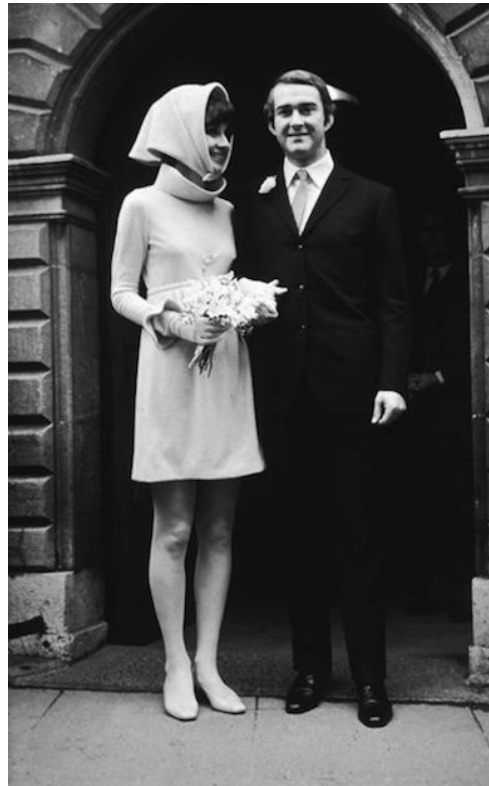
Obrázok 16. – Audrey Hepburn, Givanchy, 1969.