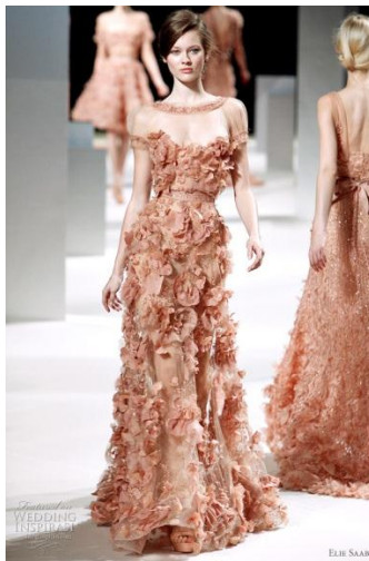
Obrázok 30. – Ellie Saab.