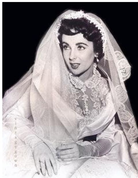
Obrázok 12. – Elizabeth Taylor, 1950.

Svadobné šaty museli byť v 50-tych rokoch na špičkovej úrovni, podľa vzoru slávnych návrhárov a na spôsob ikonických žien akými boli okrem princeznej Elizabeth aj Jacqueline Kennedy, Grace Kelly 4 , či Elizabeth Taylor. Posledná menovaná si vo filme Vincente Minnelliho Otec nevesty z roku 1950 obliekla šaty od dizajnérky Helen Rose so spadnutými ramenami, dekoltom vyplneným čipkou s elegantným golierom v štýle gothic. Šaty pôsobili na rozdiel od posledných troch desaťročí pompézne, objemne, nakoľko široká sukňa si vynútila vystuženie spodničkami. Jej závoj bol bohato nariasený a lemovaný čipkou. Moderné boli stále kučery, výrazný make up a porcelánová pleť.