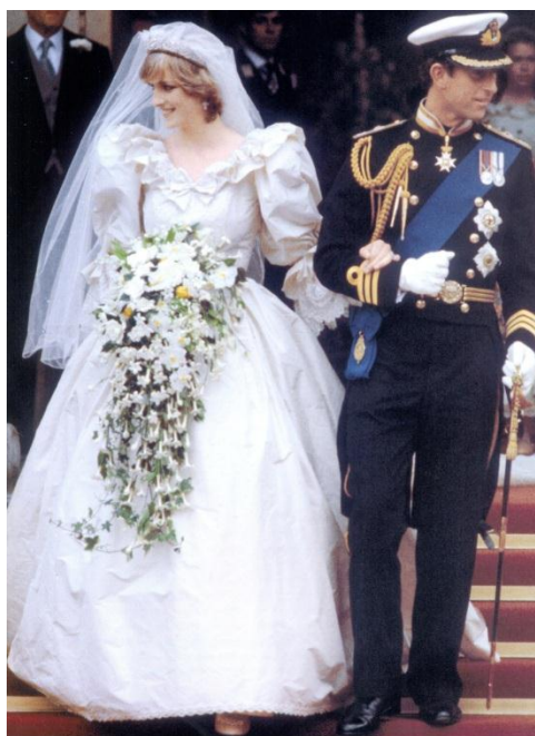
Obrázok 22. – Lady Diana Spencer a Princa Charles, 1981.