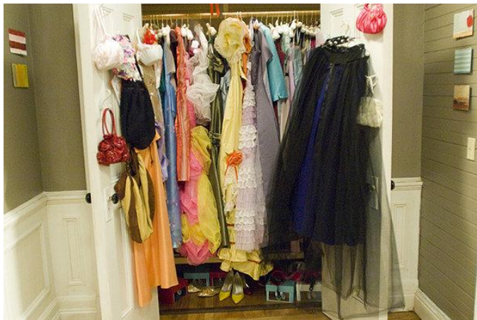
Obrázok 33. – 27 Dresses.

Každá nevesta má niekoľko predstáv, často už do malička, o štýle svojich svadobných šiat. Snívajú o pompéznej svadbe v katedrále, o formálnej svadbe na úrade, z ktorej utečú na vysnívanú dovolenku zvanú medové týždne. Snívajú o intímnej svadbe na pláži a zároveň klasickej svadbe s rodinou a priateľmi a všetkými zvykmi, ktoré ku svadbe patria. Tiahnu za originalitou tematiky natoľko, že jej podriaďujú absolútne, všetko čo s ich svadbou súvisí, dokonca aj odevy hostí a družičiek.