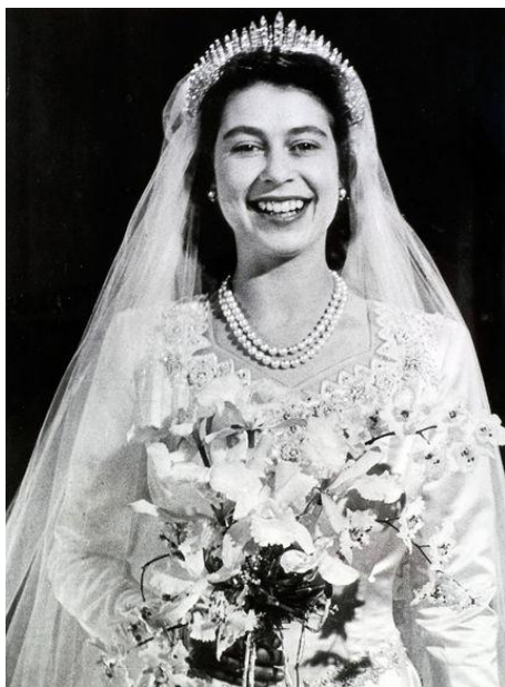
Obrázok 11. – Kráľovná Elizabeth, 1947.

čenie, aby mohla mať šaty svojich snov ( www.vogue.com ). Hartnell, ktorý vytvoril pre Elizabeth aj korunovačnú róbu, sa stal obdivovaným návrhárom a bol veľmi často kopírovaný.