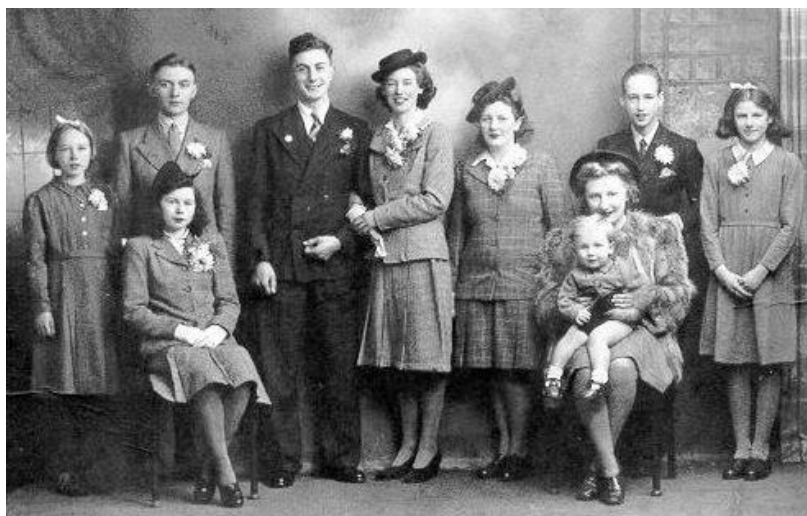
Obrázok 9. – Rodinná svadobná fotografia, 1940.