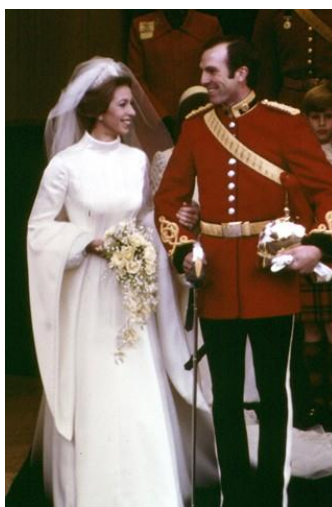
Obrázok 21. – princezná Anna, 1973.