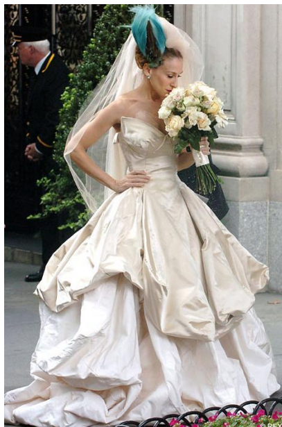
Obrázok 24. – Sex and the City.

Carolina Herrera zvolila naozaj neobyčajne jednoduchú a okúzľujúcu róbu pre hrdinku z filmu Twilight.