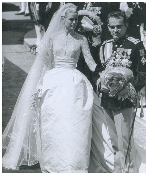
Obrázok 14. – Monacký pár, 1956.

Použitie čipky na priliehavom živôťiku, a na úzkych rukávoch sa odkazuje na dobu edwardovského štýlu, ktorý zaviedla spomínaná Consuelo Vanderbiltová. Svadobné oslavy monackého páru trvali celý týždeň. Stovky objektívov zachytili ušľachtilú krásu jednej z najpopulárnejších neviest 20. storočia (Baldrigeová, 2000. s. 10).